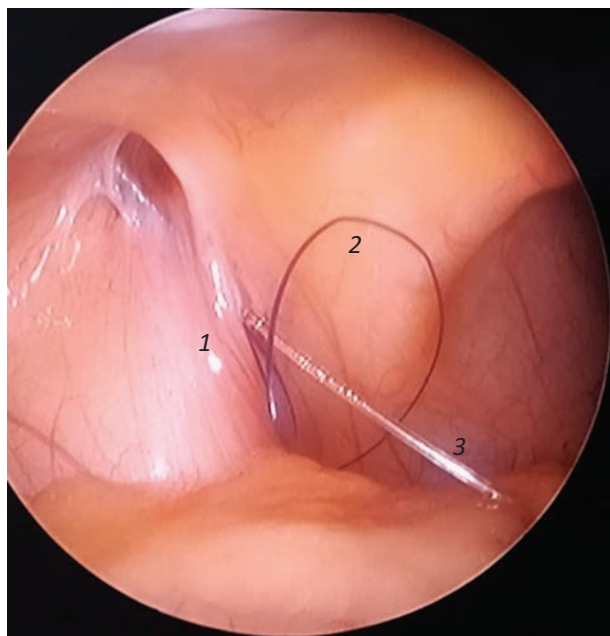
Рис. 2. Оставленные в брюшной полости нитяная петля и передний конец проводника, вид изнутри. 1 — круглая связка матки, 2 — нитяная петля, 3 — проводник

Fig. 2. Inside view of suture loop and introducer that was left in the abdominal cavity. 1 — round ligament of uterus, 2 — suture loop, 3 — introducer