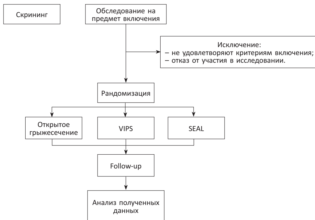
Рис. 1. Дизайн исследования

Далее было проведено стандартное предоперационное обследование, и все пациенты случайным образом в равных долях были