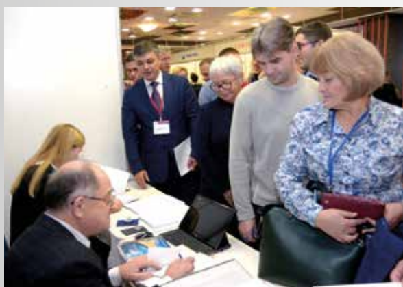
Рис. 2. Регистрация делегатов Fig.2. Registration of delegates