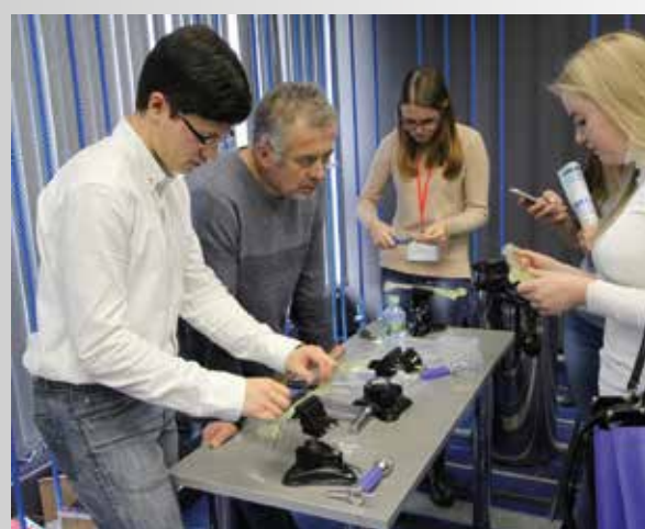
Рис. 5. Мастер-класс по остеосинтезу Fig.5. Masterclass in osteosynthesis