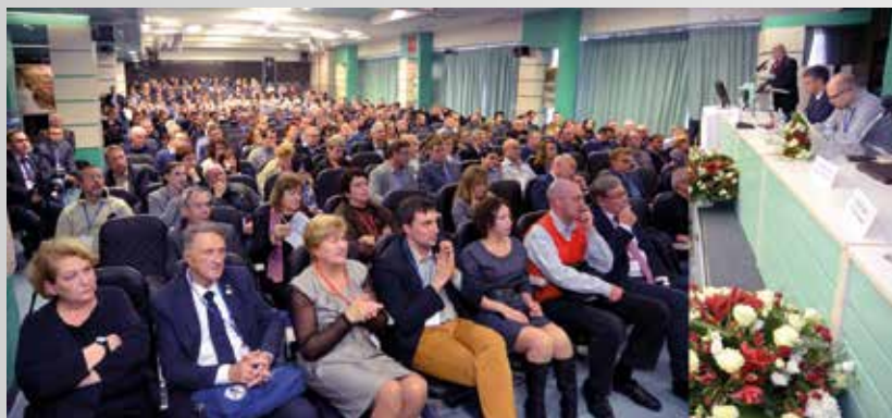
Рис. 1. Открытие Форума Fig.1. Opening the Forum