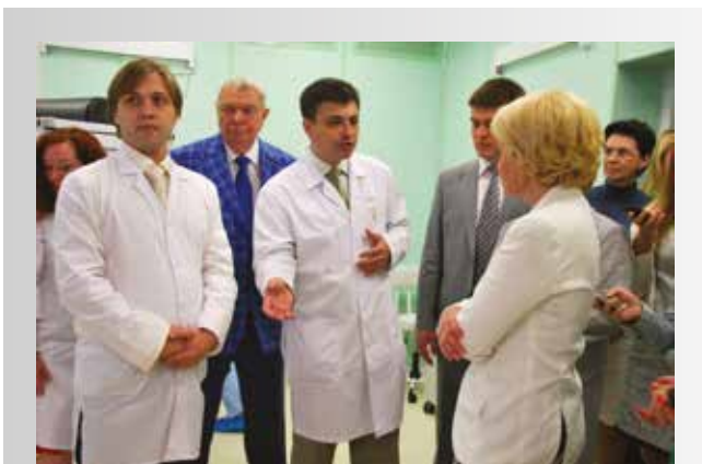
Рис. 5. Д.А. Морозов докладывает вице-премьеру Правительства РФ О.Ю. Голодец о готовности операционного блока НИИ детской хирургии (2014 год) Figure 5. D.A. Morozov reports to the Vice-Premier of the Russian Government Olga Golodets about the readiness of the surgical unit of the Institute of Pediatric Surgery (2014)