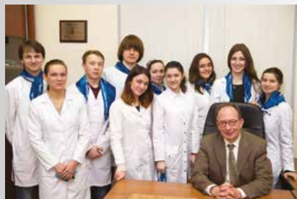
Рис. 16. Школа мастерства «Детская хирургия» с Президентом EUPSA J. M. Guys, проект – «Свенсоновские встречи» с лидерами детской хирургии. (Москва, НИИ детской хирургии НЦЗД, 2014 год)

(посттравматический гипоспленизм, аппендикулярный перитонит, инвагинация кишечника), колопроктологии (сфинктеросберегающие операции при аноректальных мальформациях, трансанальные операции при болезни Гиршпрунга, функциональные исследования в колопроктологии) и хирургической эндоскопии (конфокальная эндомироскопия), эндокринной хирургии, урологии и хирургии пато-