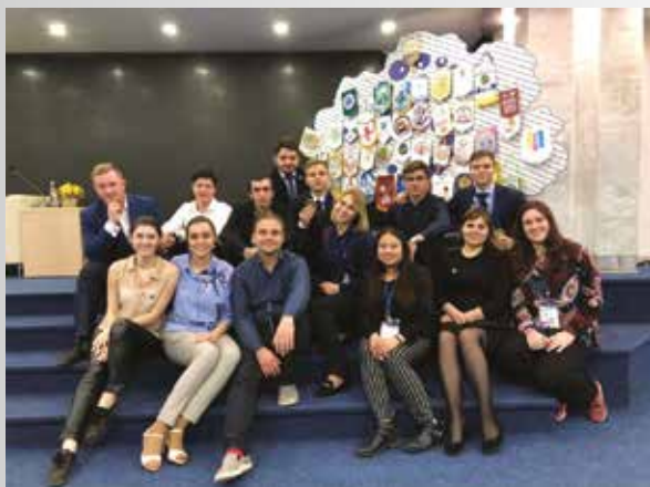
Рис. 18. Организаторы – Школа мастерства кафедры у «символического дерева» 25 Российской (59 Всесоюзной) конференции СНК по детской хирургии «Актуальные проблемы детской хирургии, анестезиологии и реаниматологии» (Сеченовский университет, 20–23 апреля 2018 года)

Figure 18. The organizers of School of Mastery next to the «symbolic tree» during the 25th Russian (59th-Union) Conference of the SSC in Pediatric Surgery «Actual problems of Pediatric Surgery, anesthesiology and critical care medicine» (Sechenov University, 20–23 April 2018).