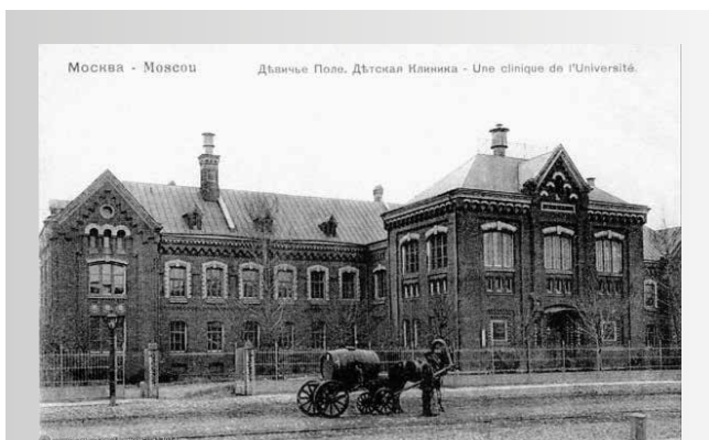
Рис. 1. Хлудовская детская больница г. Москвы с отделением детской хирургии профессора П.И. Дьяконова (1897 год)

Figure 1. Khludov Children's Hospital in Moscow, the Department of Pediatric Surgery of Professor P.I. Dyakonov (1897)