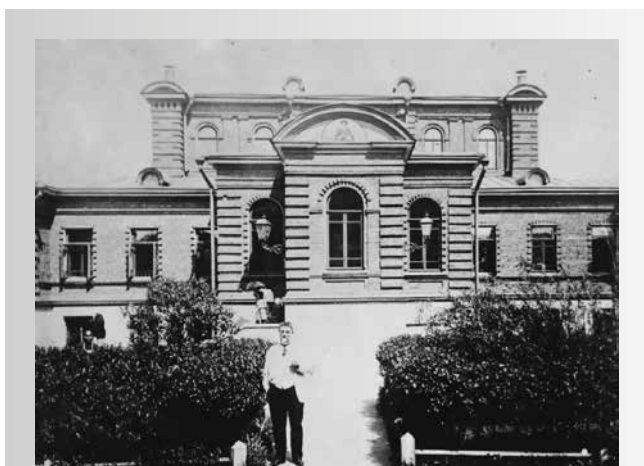
Рис. 2. Амбулатория детской больницы св. Ольги г. Москвы (1898 год)

Figure 1. Khludov Children's Hospital in Moscow, the Department of Pediatric Surgery of Professor P.I. Dyakonov (1897)