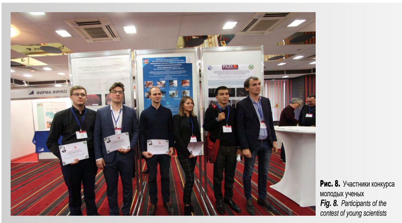
Рис. 8. Участники конкурса молодых ученых Fig. 8. Participants of the contest of young scientists

ственного медицинского университета) с докладом «Лапароскопическое лечение эхинококковых кист печени у детей».