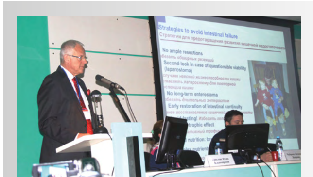
Рис. 4. Выступает профессор Л. Вессель (Германия) на круглом столе по «Синдрому короткой кишки» Fig. 4. Speaker Professor L. Wessel (Germany) at the round table on "Short Bowel Syndrome"