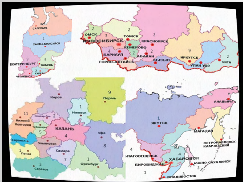
Рис. 6-7. Распределение делегатов Конгресса по Федеральным округам Российской Федерации Fig. 6-7 Distribution of participants in the Congress by subjects and cities Russian Federation

Все федеральные округа Российской Федерации делегировали на Конгресс своих представителей, территориальное распределение которых представлено на рис. 6-7.