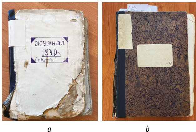
Рис. 1. Журналы поступления и операций: a — 1940–1941 гг.; b — 1943–1944 гг.