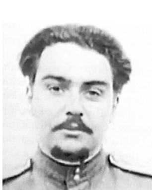
Рис. 14. Г.А. Байров. Fig. 14. G.A. Bairov.