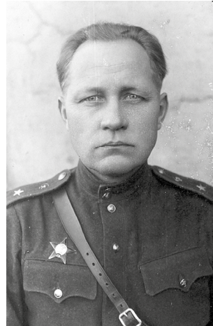
Рис. 18. В.С. Панушкин. Fig. 18. V.S. Panushkin.