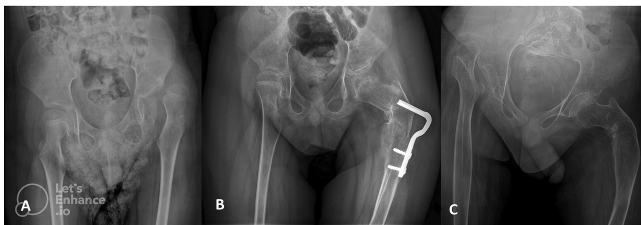
Рис. 2. Рентгенограммы пациента 6 лет с церебральным параличом: a — односторонний вывих левого бедра. Миграционный индекс Реймера правого бедра составляет 18 %; b — деротационно-варизирующую остеотомию проводили на левом бедре; c — через 2 года после операции развился вывих правого бедра

Fig. 2. X-rays of patient 6 year-old with cerebral palsy: a — with a unilateral left hip dislocation; b — the right hip's Reimer's Migration Index is 18%. Varus derotation osteotomy was performed on the left hip; c — two years after the operation, the right hip is dislocated