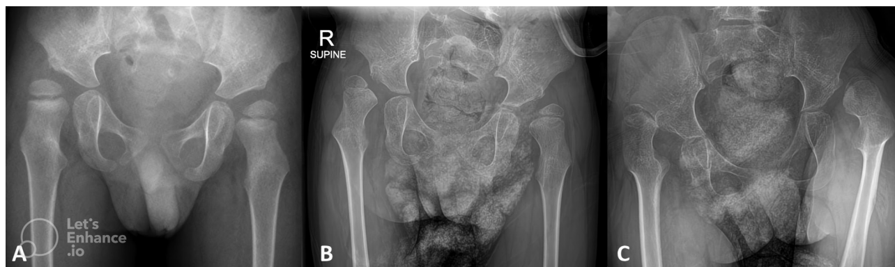
Рис. 3. Рентгенограммы пациента 3 лет с церебральным параличом: a — вывих правого бедра. Миграционный индекс Реймера левого бедра составляет 36 %; b — была запланирована деротационно-варизирующая остеотомия, но родители ребенка отказались; c — последующее прогрессирование вывиха обоих бедер

Различие показателей RMI, AI, SEA и ПТ до операции свидетельствует, что они могут быть значимыми прогностическими факторами развития вывиха контралатерального бедра. Однако при многофакторном анализе с применением модели логистической регрессии прогностическими факторами считались только RMI > 25 % и возраст < 9 лет. Предлагаемая система балльной оценки может помочь хирургам принять решение о проведении превентивного оперативного вмешательства на контралатеральном бедре.